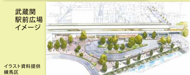
武蔵関駅前広場イメージ