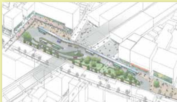
上石神井駅前広場イメージ

☆上石神井駅周辺南北道路と交通広場は、平成30年12月に事業認可を受け、用地取得の為の事業が進んでいます。 ☆武蔵関駅周辺駅前広場は、令和3年11月に都市計画決定し令和4年～令和5年度中に事業認可を目指しています。