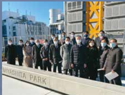
渋谷区のMIYASHITA PARK (宮下公園)を視察