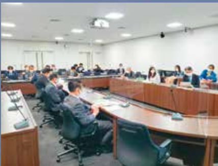
豊島区の防災公園等について説明を受ける