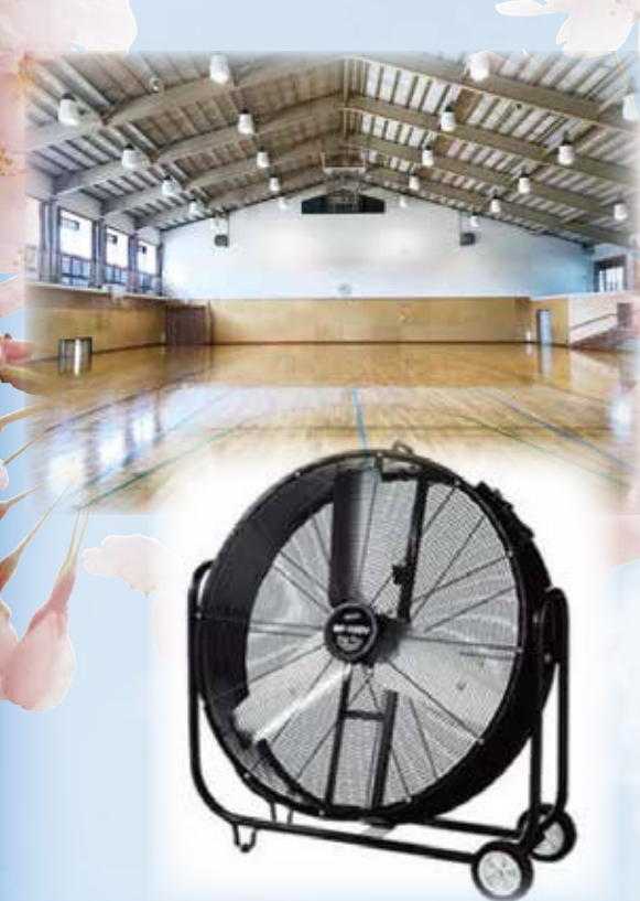
イメージ図:羽根径100cm ビッグファン

そこで・・・平成30年度中に業務用大型扇風機(羽根径100cm)を 各校3台ずつ 配備します!!夏場は熱中症対策に、それ以外の季節にはサーキュレーターとして利用できます。