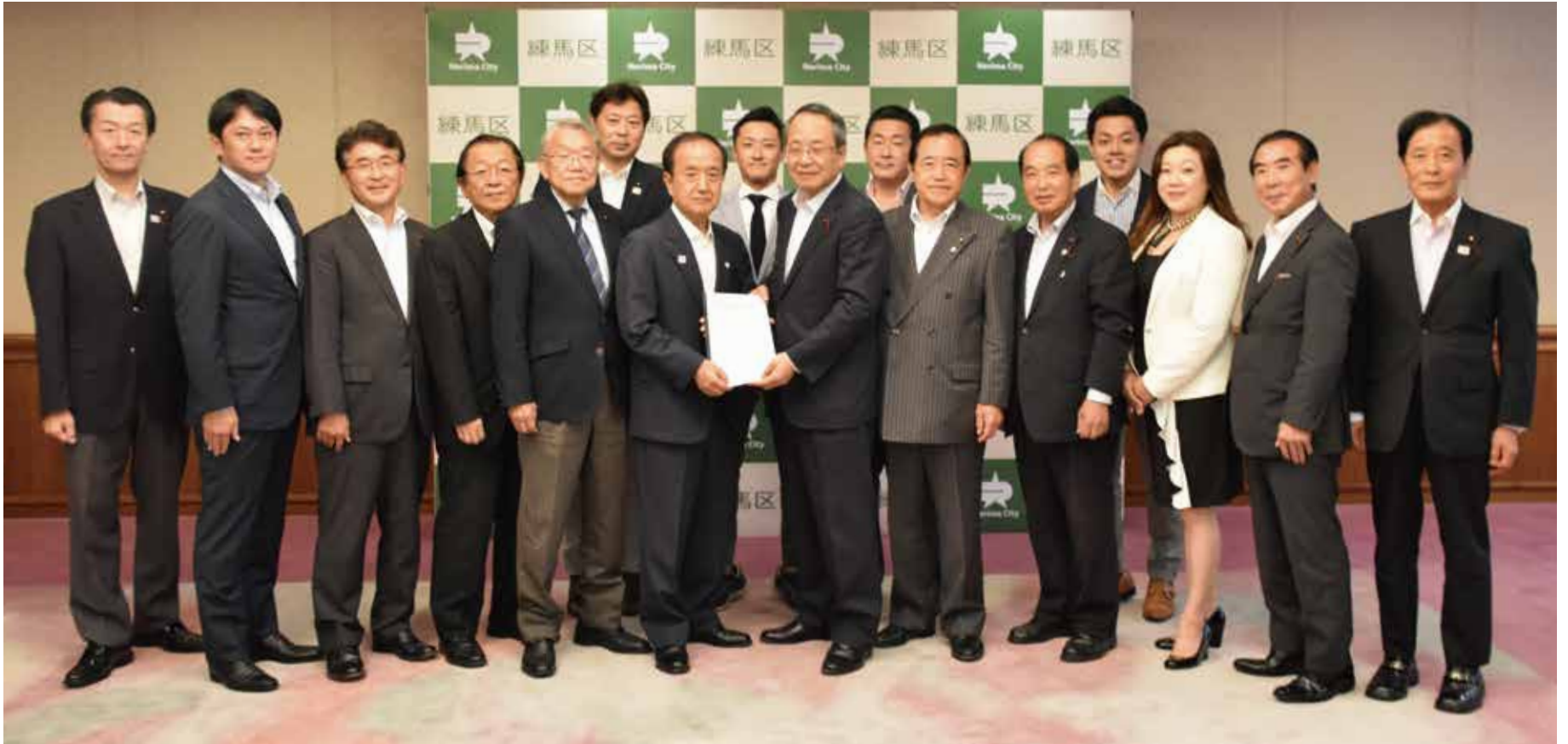
平成28年度練馬区一般会計及び特別会計歳入歳出決算の認定、平成29年度補正予算を成立